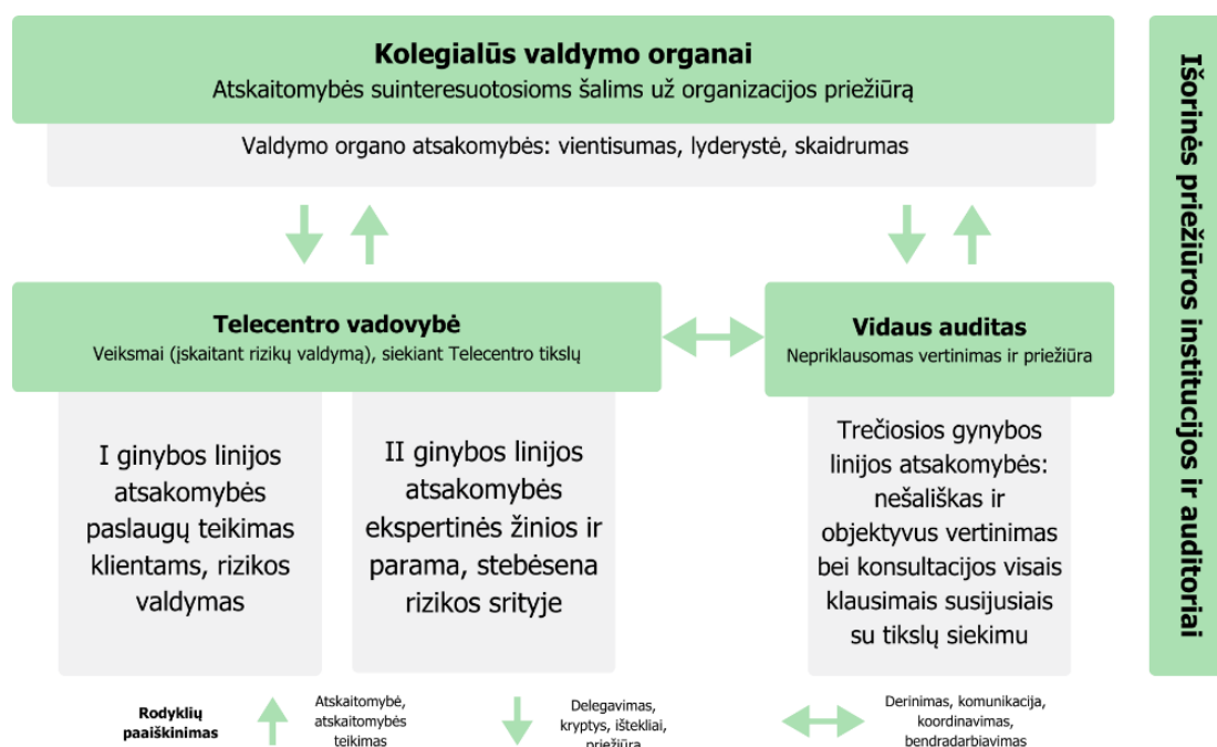
pav. 2 Trijų linijų gynybos modelis

14. Išorinės priežiūros institucijos ir auditoriai (pavyzdžiui, RRT, VDAI, NKSC ar kitos institucijos pagal veiklos specifiką) atlieka išorinę kontrolę ir vertinimą, užtikrindami organizacijos veiklos skaidrumą, atitiktį ir patikimumą.